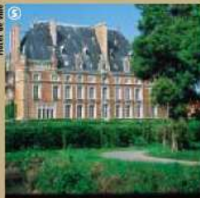
Hôtel de ville

L'Eglise Saint Pierre fut également reconstruite à partir de 1924, selon les plans du célèbre architecte ; elle se distingue par deux hautes tours, surélevées d'une calotte byzantine, qui encadrent la façade du sanctuaire. Il a en réalité, redonné vie à un édifice, une