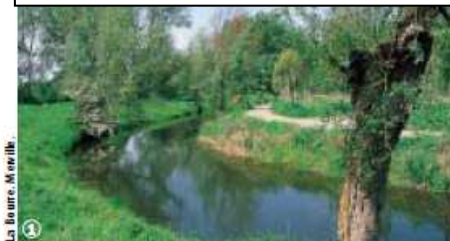
La Rivière, Merville