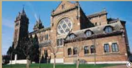
Eglise de Merville

qui avait acquis un certain renom grâce à la réalisation du Palais de la Paix à La Haye et de la Vieille Bourse à Lille.