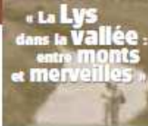
Cadrans : Pierre Eillon - Ulin

Office de Tourisme de Merville : 03.28.43.67.96