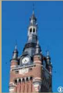
Hôtel de ville de Merville